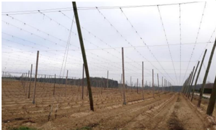
Abb. 1: Hopfengarten nach der Ernte (ohne Einsaat in der Fahrgasse)