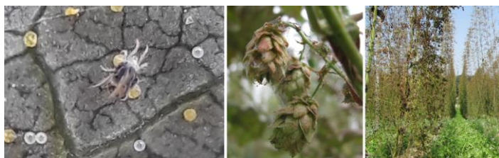
Abb. 4: Gemeine Spinnmilbe mit Eiern, Doldenbefall und extremes Schadbild

Werden heimische Raubmilben eingesetzt, zeigen sich deutlich geringere Schädigung der Hopfendolden als in der unbehandelten Kontrolle. Mit zugekauften Raubmilben fällt der optische Doldenschaden noch geringer aus. Bei Dolden aus der Praxis (mit Akarizid behandelt) schwankt die Schädigung stark, je nach der Verteilung des Pflanzenschutzmittels im Bestand. Die Wirkung eines Akarizids können Raubmilben bei starkem Befall jedoch nicht ersetzen.