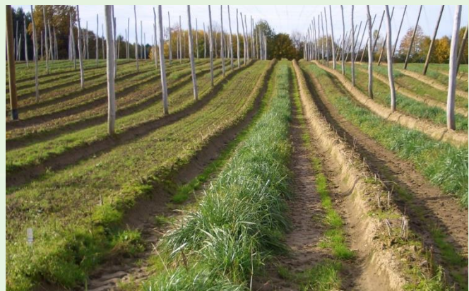
Abb. 2: Etablierter Rohrschwengel (rechts) gegen praxisübliche Einsaat (links)