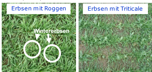
Abb. 3: Gemengebestände in DAR, Ende November 2011

Vorteilhaft für den Erbsenreinertrag waren Gemengepartner, die eine geringe Konkurrenzwirkung aufwiesen. Auf dem Standort DFH entwickelte sich die Triticale sehr üppig und war konkurrierender als Raps und Rübsen. Dagegen entwickelte sich der Roggen auf dem Standort DAR schon in der Vorwinterentwicklung üppiger als die Triticale (Abb. 3).